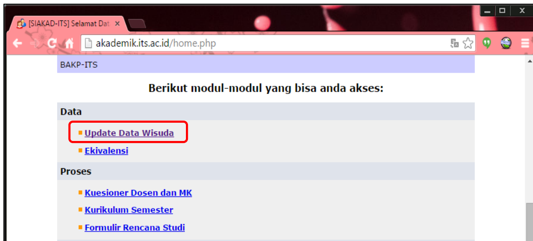
Gambar 2. Update Data Wisuda pada SIMAKAD