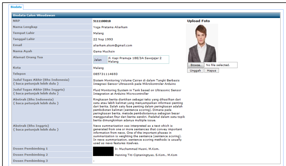
Gambar 9. Ringkasan Biodata Calon Wisudawan beserta foto