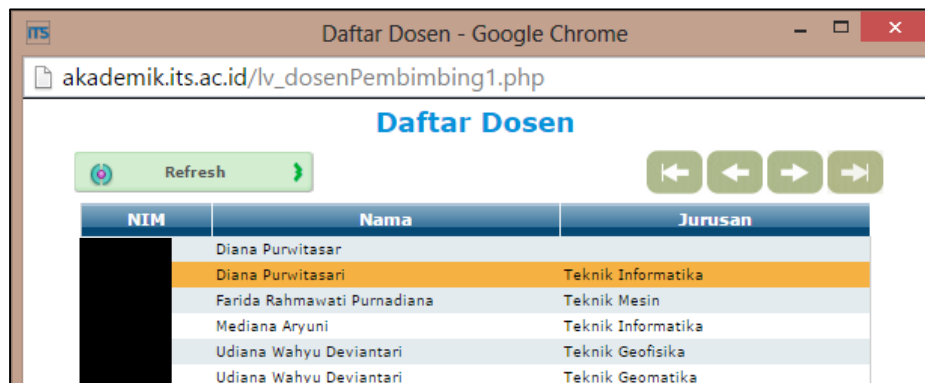
Gambar 6. Hasil Pencarian Dosen Pembimbing