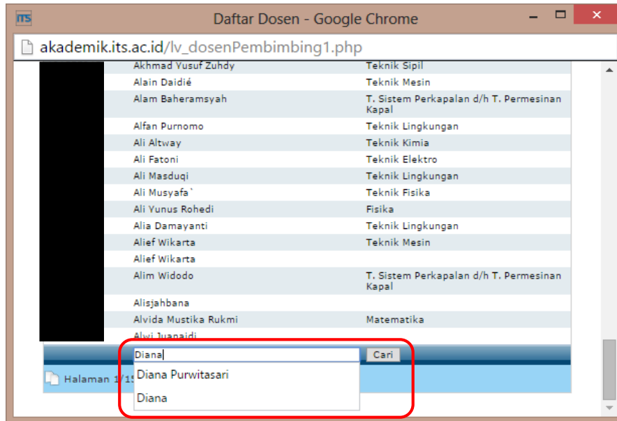
Gambar 5. Cari Dosen Pembimbing