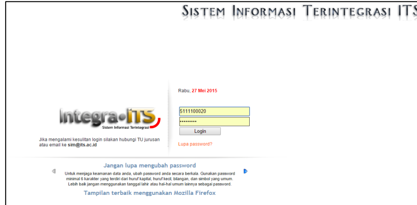
Gambar 1. Halaman Login Integra